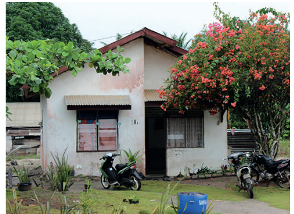
Akomodasi yang aman dan higienis penting bagi kesejahteraan dan produktifitas pekerja di perusahaan