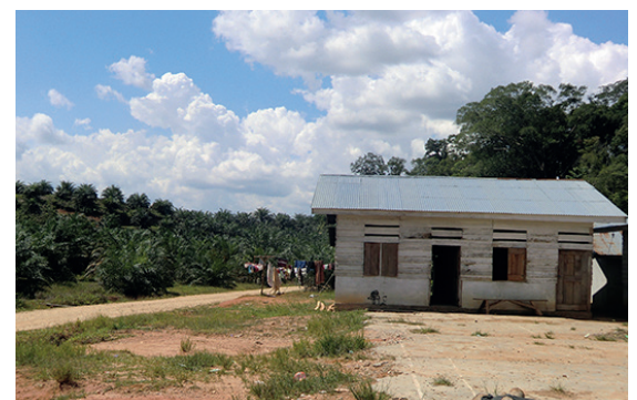
Akomodasi harus bisa dikunci dari dalam

• Konvensi Pekerja Migran ILO menyatakan bahwa pekerja migran harus mendapatkan akomodasi dengan standard yang sama dengan pekerja bukan migran. 4